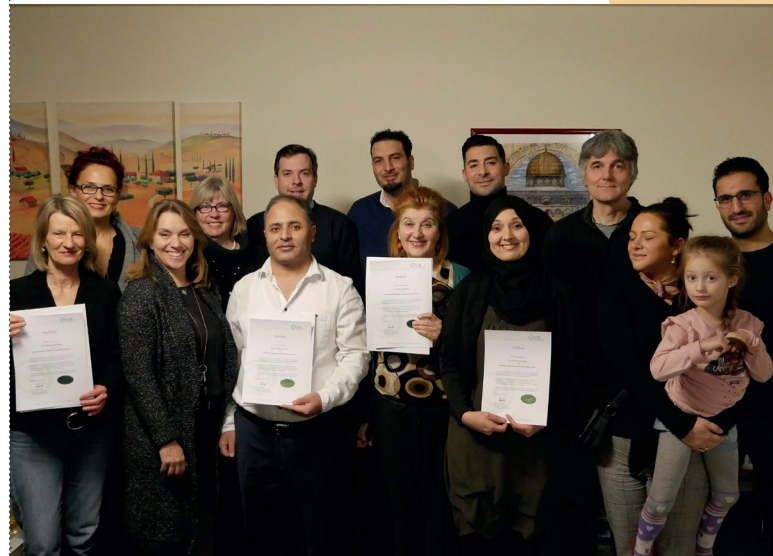
Ausbildung 2016 - 2017 | Glücklicher Abschluss nach der Zertifizierung

Berufsausbildung/-erfahrung oder Studium, Kommunikationsstärke, Einfühlungsvermögen, Lebens- erfahrung.